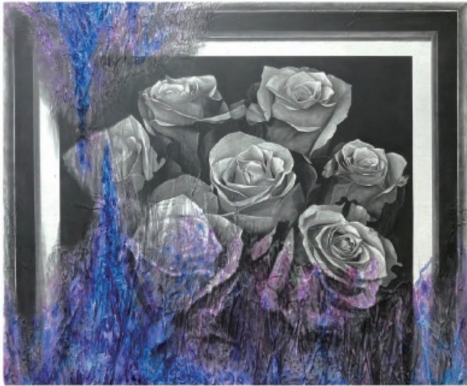
ステッカー化作品

また、投票で見事1位に選ばれたアーティストには、後日JR名古屋駅で作品を掲出できる権利を授与。ポスター化したものを改札内通路に展示する予定です。