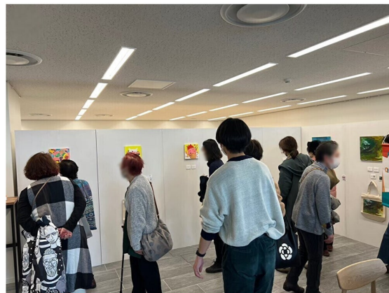
第一回アトコレの様子

アトコレ開催期間中、アーティストの作品をグッズ化したものをJR東海MARKETにて販売し、アーティスト間で売り上げを競います。（グッズを見る： https://market.jr-central.co.jp/shop/c/cartkake/ ）グッズの売上が高かったアーティストは、展示招待や特別グッズの作成などの機会提供を受けられるという仕組み。また、このような展示会を公共空間や商業施設で行うことで、消費者との接触機会を創出します。