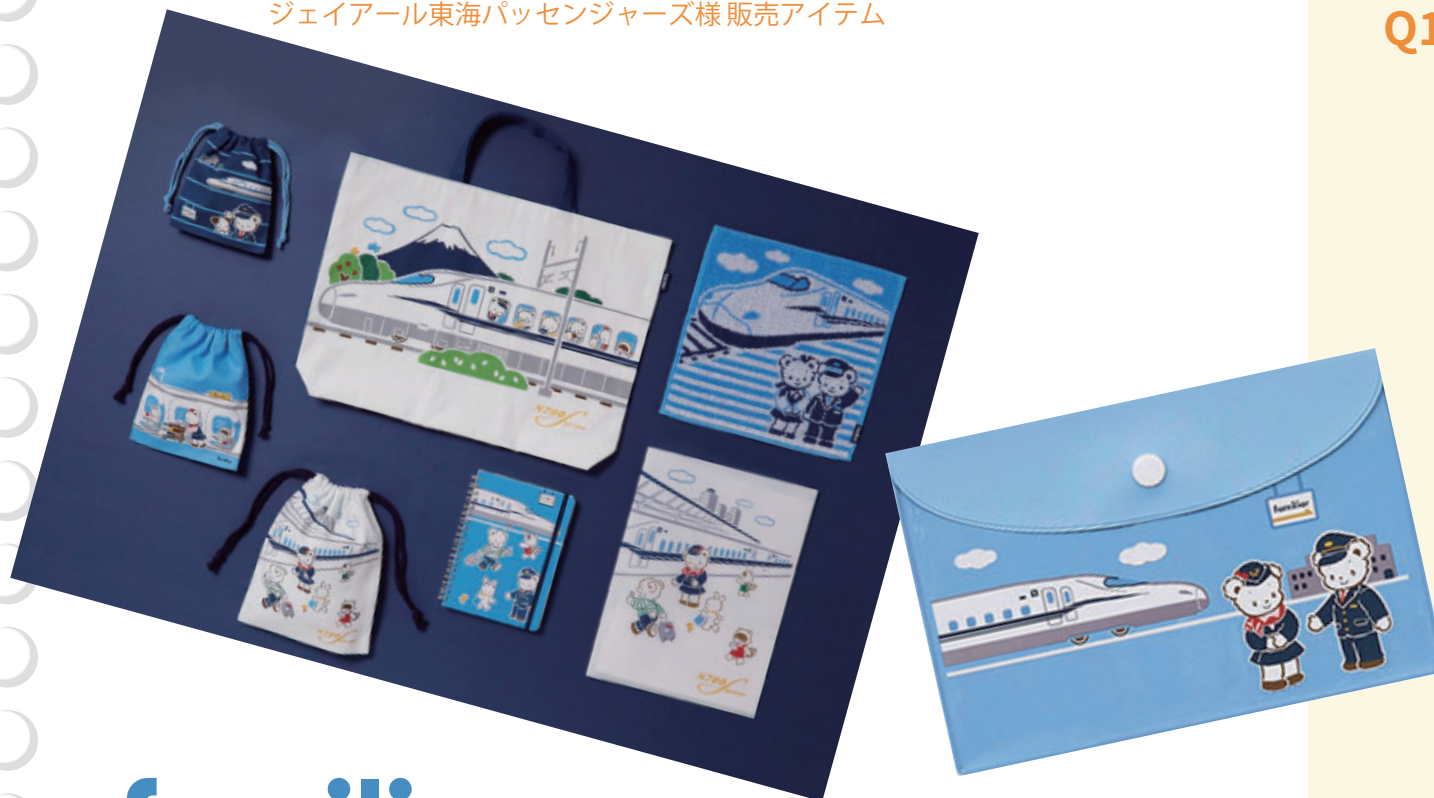
ジェイアール東海パッセンジャーズ様販売アイテム