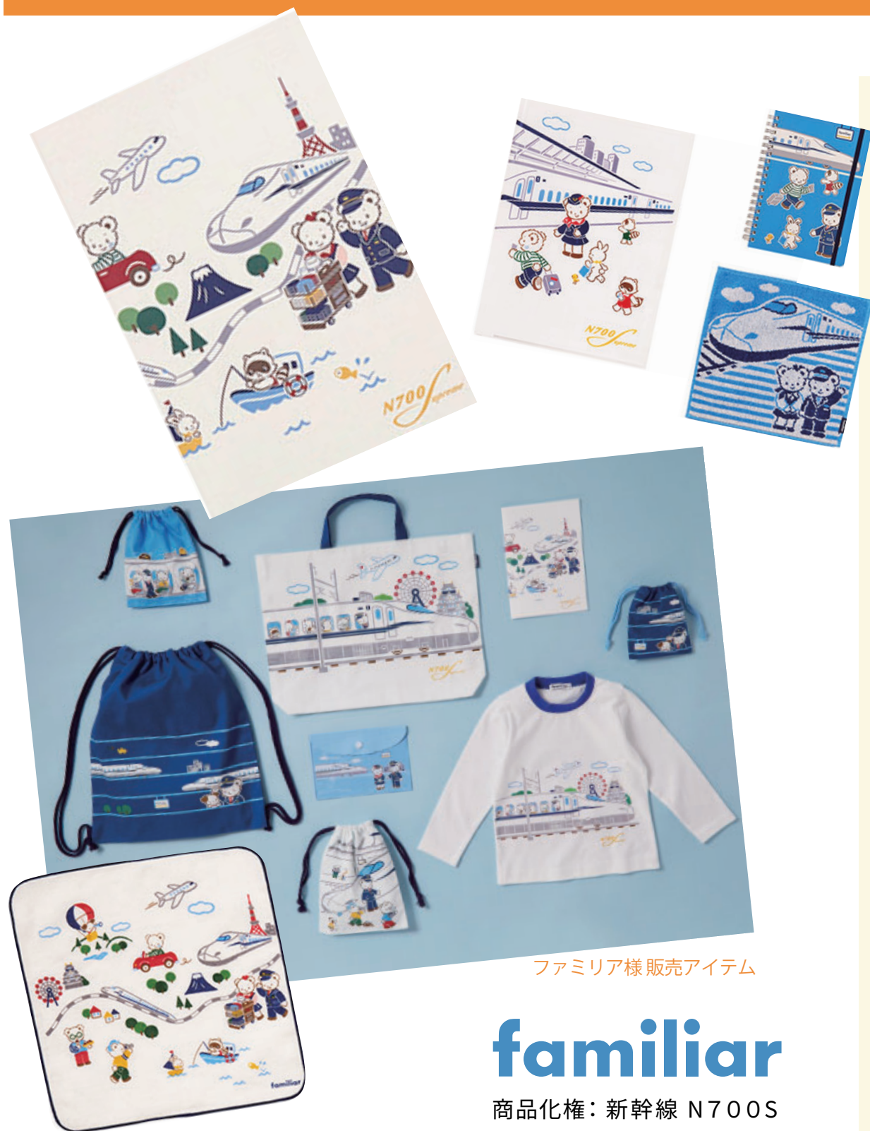
ファミリア様販売アイテム