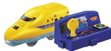
923形ドクターイエロー