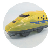
923形ドクターイエロー (秘密のおもちゃ)