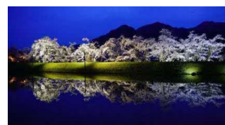
御所桜 開花の様子