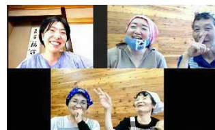
過去のヒダスケ!の様子