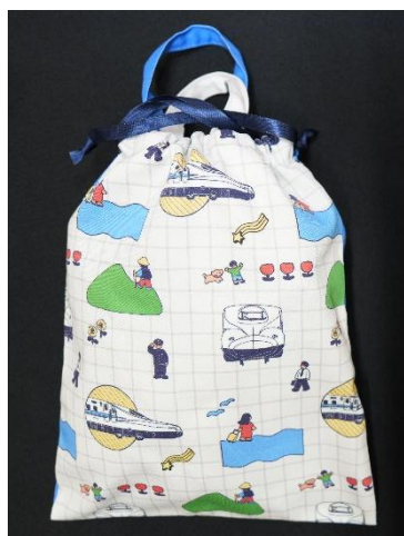
巾着トートバッグ