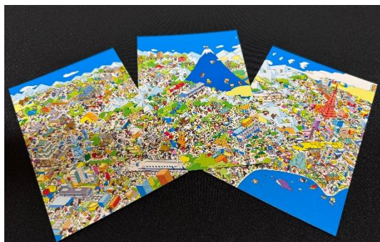
「品川⇄名古屋」ポストカード