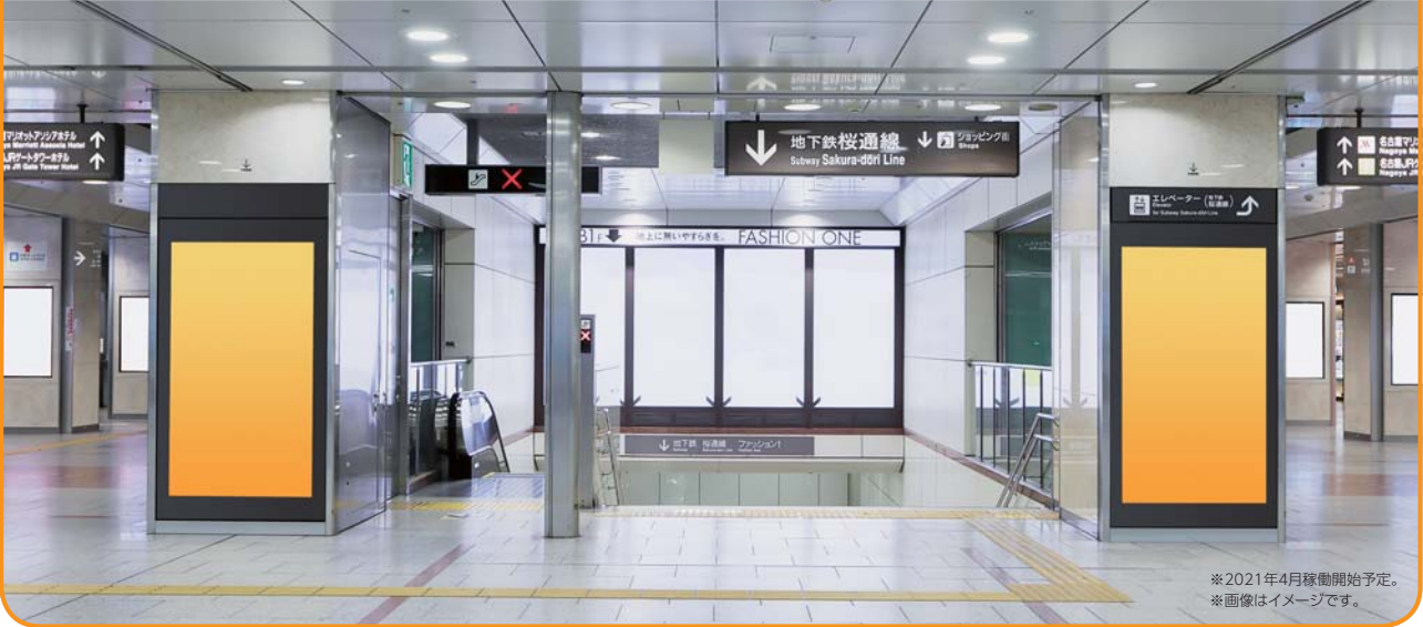
※2021年4月稼働開始予定。 ※画像はイメージです。

名古屋駅有数の待ち合わせ場所でもある新幹線改札口付近に左右2面の大型ビジョン(縦型)を新設しました。新幹線利用者に加え、東海圏在住の駅利用者にも接触を図ることができ、高精細な4K放生素材にも対応しています。