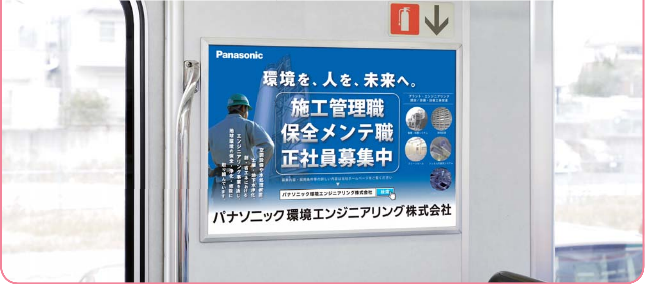
乗降ドアの側壁での掲出になります。

乗降ドアの側壁での掲出により視認性・注目率が高く、 また鉄道利用者の目線とポスターが近いことから詳細情報の訴求が可能です。