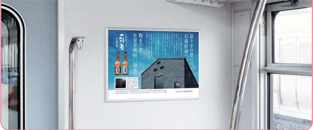
車両連結部のドア側壁での掲出になります。

連結部ドアの側壁での掲出により視認性・注目率が高く、 また鉄道利用者の目線とポスターが近いことから詳細情報の訴求が可能です。