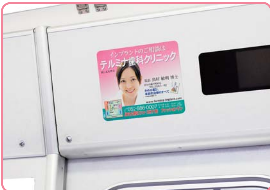
車両内の乗降ドア上(案内テロップ横)での掲出になります。

駅名などの運行情報が流れる案内テロップ横への掲出で、効率的なアイキャッチが可能です。