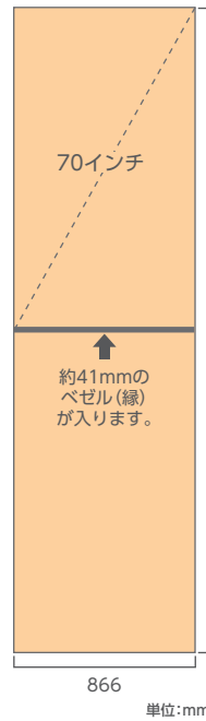
名古屋駅 ツインビジョン 桜通口