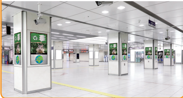
〈名古屋駅新幹線口〉