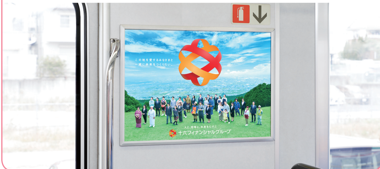
乗降ドアの側壁での掲出になります。

乗降ドアの側壁での掲出により視認性・注目率が高く、 また鉄道利用者の目線とポスターが近いことから詳細情報の訴求が可能です。