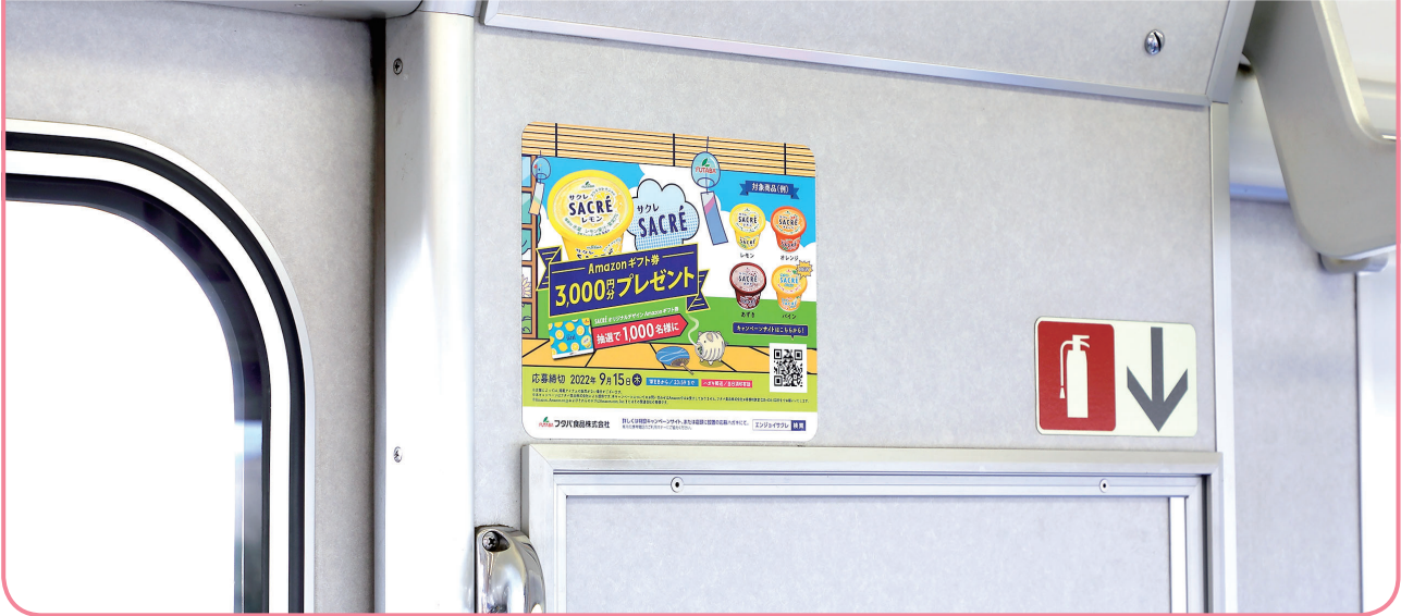
315系は乗降ドア付近の窓ガラスでの掲出になります。

車両内乗降ドア付近への掲出は鉄道利用者の視線の高さに近く、視認性の高いメディアです。