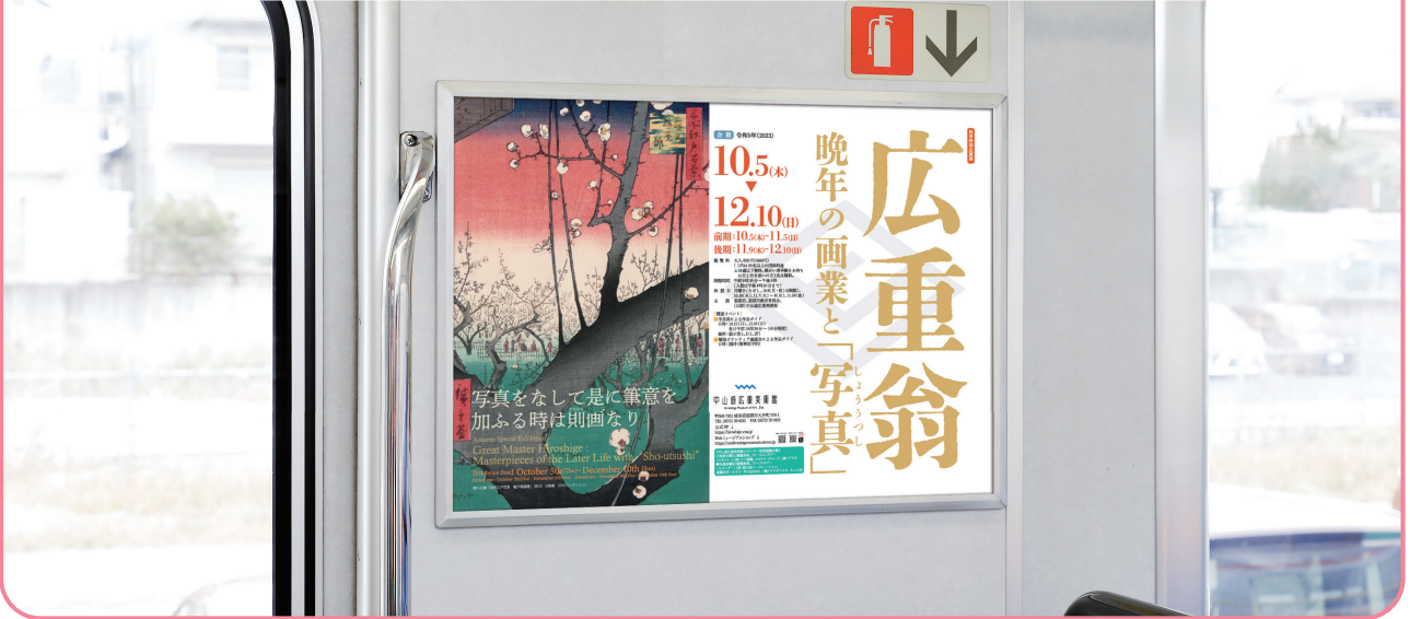
乗降ドアの側壁での掲出になります。

乗降ドアの側壁での掲出により視認性に優れ また鉄道利用者の目線とポスターが近いことから詳細情報の訴求が可能です。