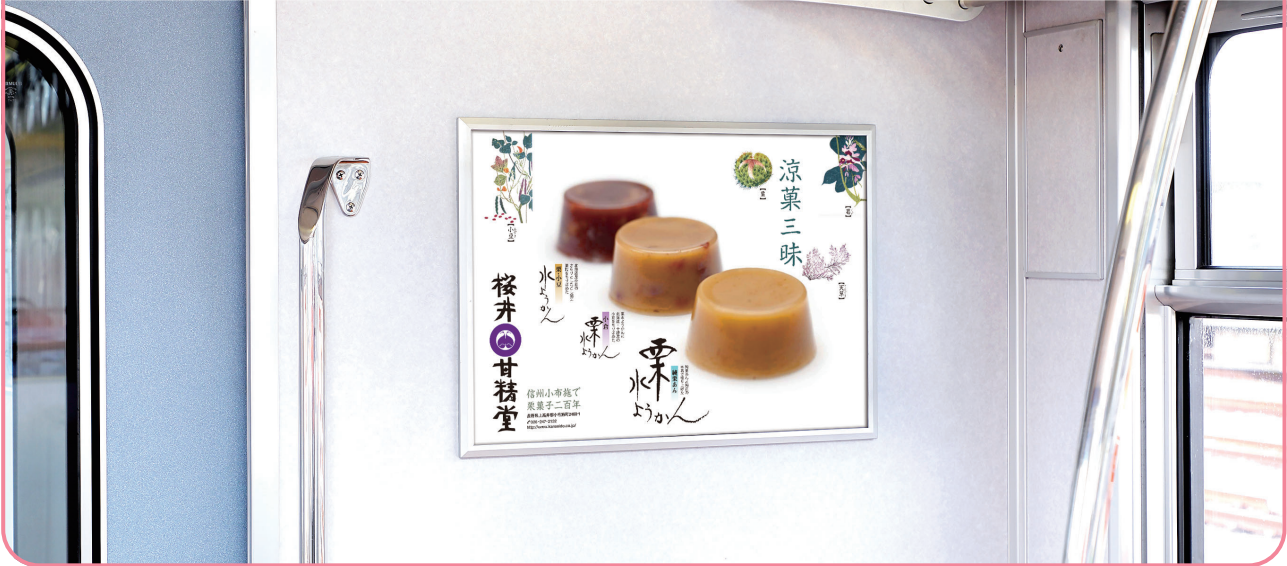
車両連結部のドア側壁での掲出になります。

連結部ドアの側壁での掲出により視認性に優れ また鉄道利用者の目線とポスターが近いことから詳細情報の訴求が可能です。