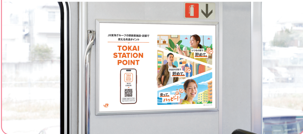
乗降ドアの側壁での掲出になります。

乗降ドアの側壁での掲出により視認性に優れ また鉄道利用者の目線とポスターが近いことから詳細情報の訴求が可能です。