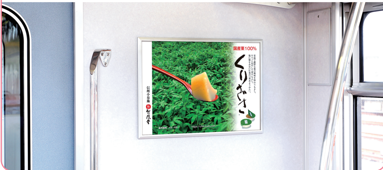
車両連結部のドア側壁での掲出になります。

連結部ドアの側壁での掲出により視認性に優れ また鉄道利用者の目線とポスターが近いことから詳細情報の訴求が可能です。