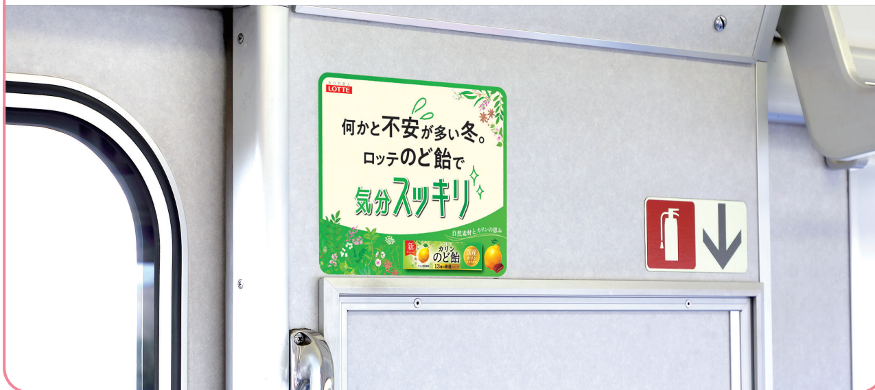
315系は乗降ドア付近の窓ガラスでの掲出になります。広告意匠のパッケージデザインは現行品とは異なります。

車両内乗降ドア付近への掲出は鉄道利用者の視線の高さに近く、視認性の高いメディアです。