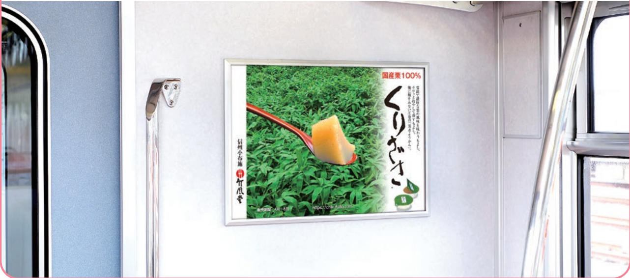
車両連結部のドア側壁での掲出になります。

連結部ドアの側壁での掲出により視認性に優れ また鉄道利用者の目線とポスターが近いことから詳細情報の訴求が可能です。