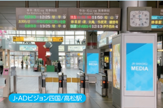
J・ADビジョン四国/高松駅