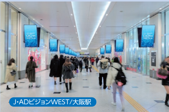
J・ADビジョンWEST/大阪駅