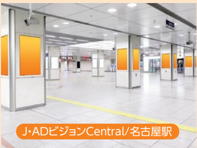
J・ADビジョンCentral/名古屋駅