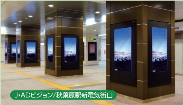
J・ADビジョン/秋葉原駅新電気街口