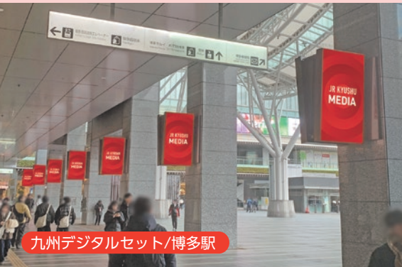
九州デジタルセット/博多駅