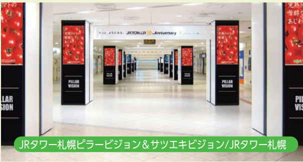
JRタワー札幌プラザビジョン&サツエキビジョン/JRタワー札幌