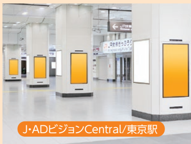
J・ADビジョンCentral/東京駅