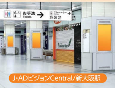
J・ADビジョンCentral/新大阪駅