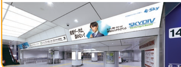
〈東京駅 壁面シート(D)〉