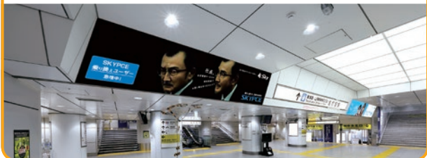
〈東京駅 壁面シート(A)〉