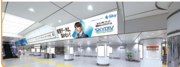
〈東京駅 壁面シート(B)〉