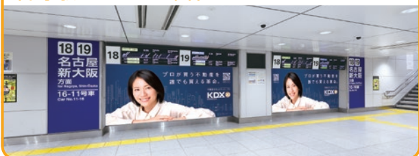
〈東京駅 壁面シート(E)〉