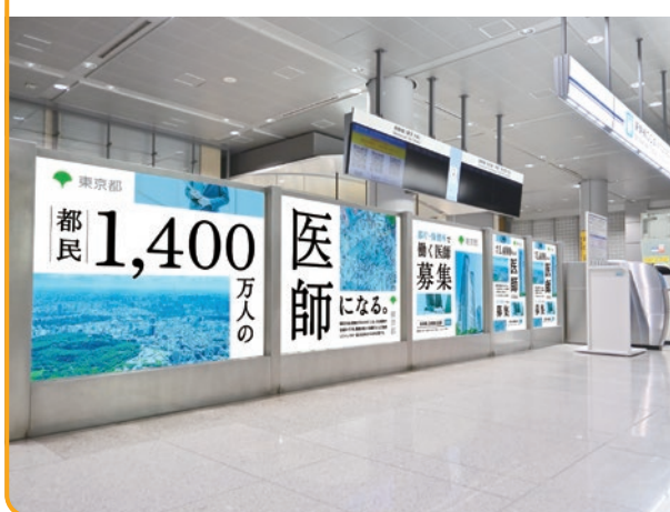
〈品川駅北乗換口ガラス面シート〉