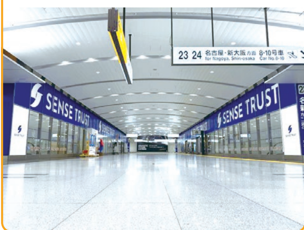
〈品川駅北コンコースガラス面シート〉