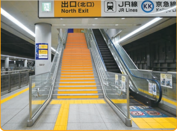
＜品川駅上りホームステップ広告 (A/B/C)＞