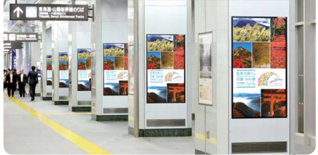
〈東京駅八重洲南北通路〉