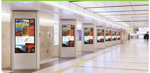
〈名古屋駅地下通路〉