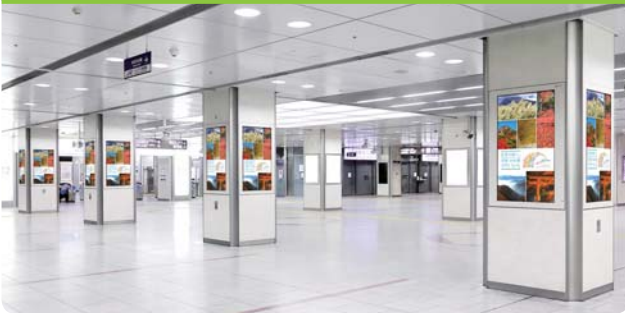
〈名古屋駅新幹線口〉