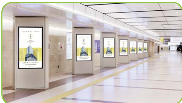
〈名古屋駅地下通路〉