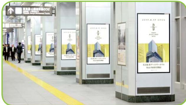
〈東京駅八重洲南北通路〉