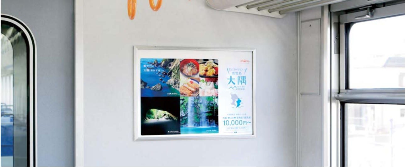
車両連結部のドア側壁での掲出になります。

連結部ドアの側壁での掲出により視認性・注目率が高く、 また鉄道利用者の目線とポスターが近いことから詳細情報の訴求が可能です。