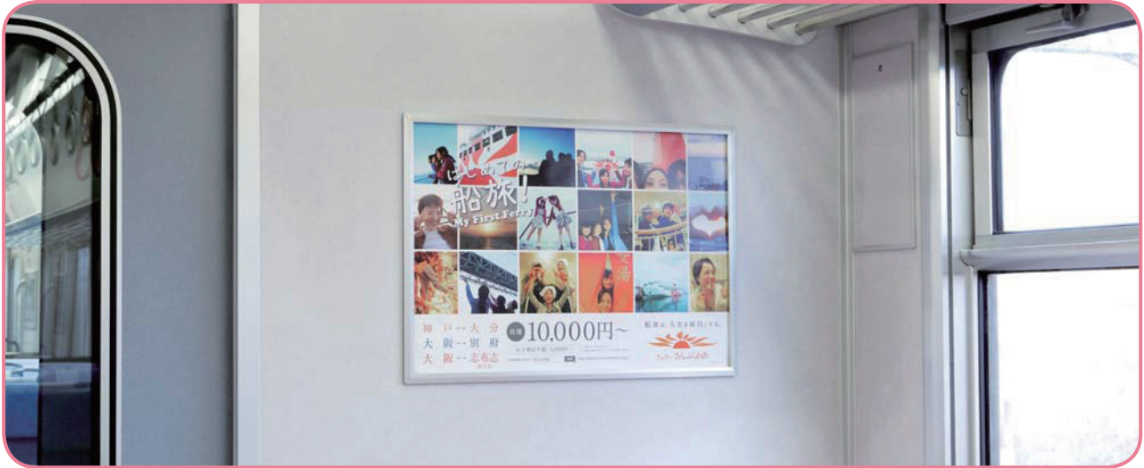
車両連結部のドア側壁での掲出になります。

連結部ドアの側壁での掲出により視認性・注目率が高く、 また鉄道利用者の目線とポスターが近いことから詳細情報の訴求が可能です。