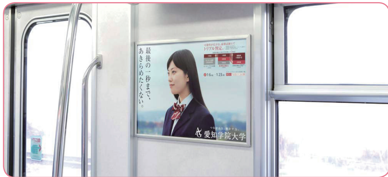
乗降ドアの側壁での掲出になります。

乗降ドアの側壁での掲出により視認性・注目率が高く、 また鉄道利用者の視線とポスターが近いことから詳細情報の訴求が可能です。