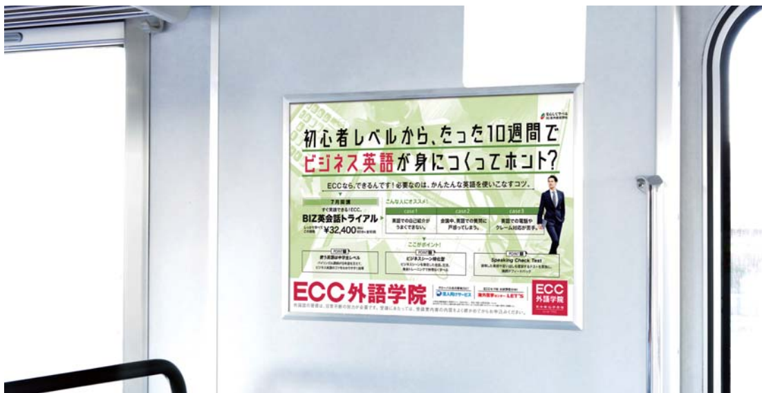
乗降ドアの側壁での掲出になります。